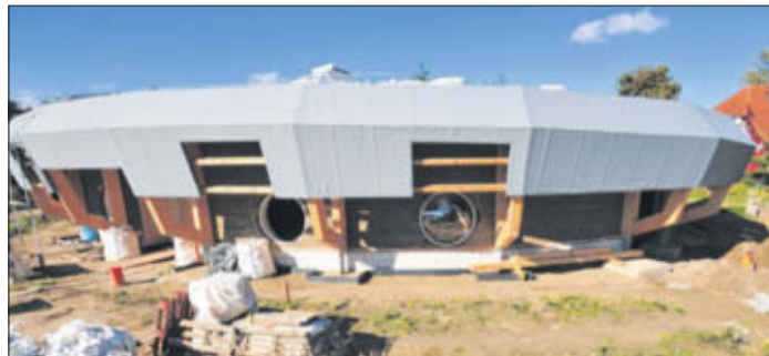
Das „UFO“ am Rande von Garz, ein innovativer Kindergarten-Neubau des DRK-Kreisverbandes.