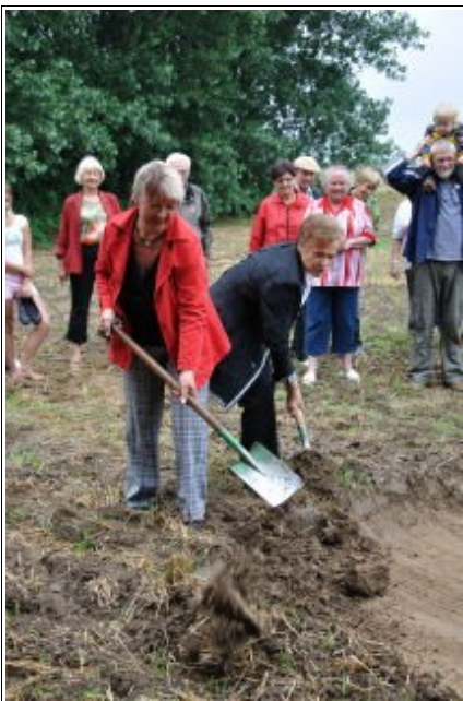
Beim ersten Spatenstich

Um 14 Uhr treffen wir uns in Glewitz. 13 Jahre haben wir um diesen Weg zwischen Glewitz und Garz gekämpft. Viele sind uns in dieser Zeit zu Verbündeten geworden. Darum haben wir sie eingeladen: Vertreter des Landtages, der Landesregierung, des Landkreises, des Amtes Bergen und Mitarbeiter in Behörden und Betrieben.