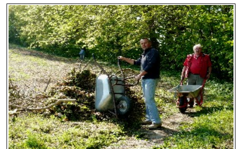
Frühjahrsputz am Burgwall